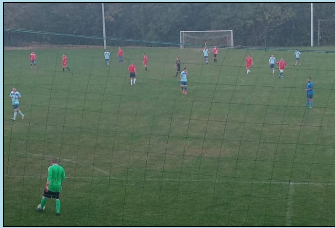
Slike s utakmice Slunj – Vojnić 95