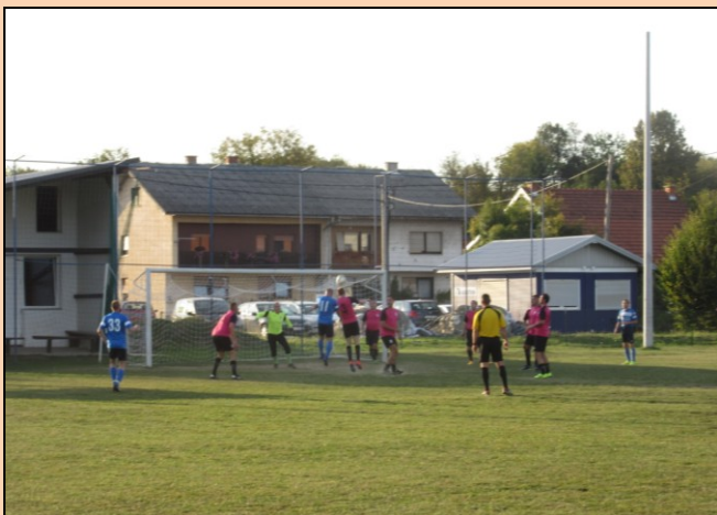
Slike s utakmice Mostanje – Duga Resa